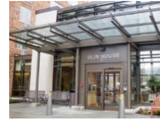
乌林之家 (Ulin House ) 马萨诸塞州布莱顿