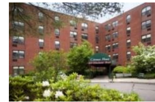
科尔曼之家 (Coleman House ) 马萨诸塞州牛顿