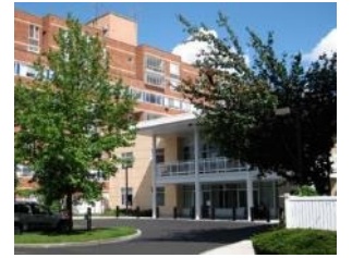
库尔拉特之家 (Kurlat House ) 马萨诸塞州布莱顿