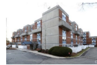
莱文塔尔之家 (Leventhal House ) 马萨诸塞州布莱顿