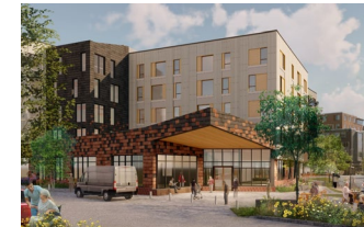
J.J. 卡罗尔之家 (J.J.Carroll House ) 马萨诸塞州布莱顿