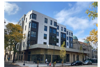
布朗家庭住宅 (Brown Family House ) 马萨诸塞州布鲁克林