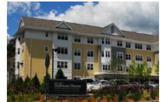
希尔曼之家 (Shillman House ) 马萨诸塞州弗雷明汉