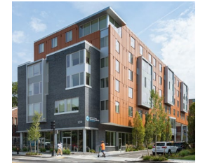
温伯格之家 (Weinberg House ) 马萨诸塞州布莱顿